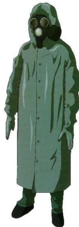
Общевойсковой защитный комплект ОЗК