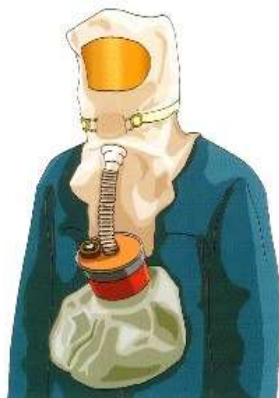
Самоспасатель изолирующий СПИ-20