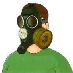
Противогаз гражданский фильтрующий ГП-7