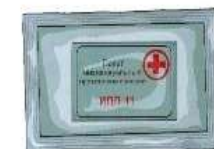
Индивидуальный противохимический пакет ИПП-11