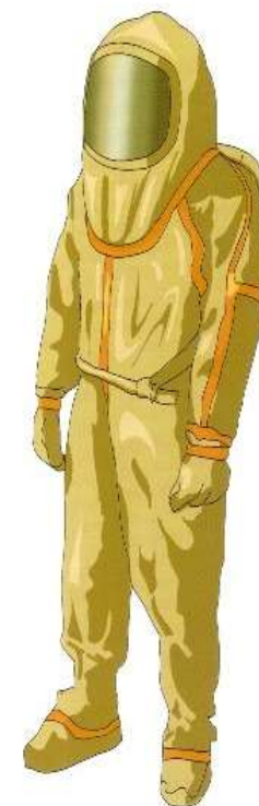
Костюм изолирующий КИХ-5