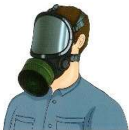
Противогаз промышленный фильтрующий ПФМ-1