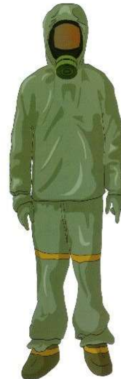
Лёгкий защитный костюм Л-1