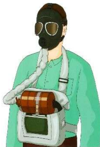
Противогаз изолирующий ИП-4М