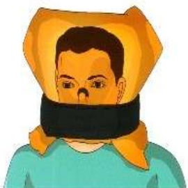
Самоспасатель фильтрующий «Феникс»