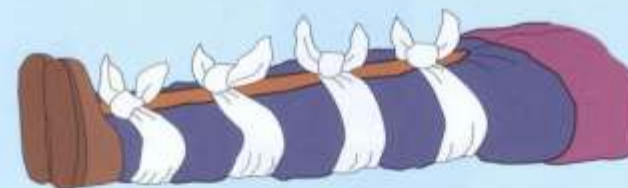
Прибинтовыванием к здоровой ноге (голень)