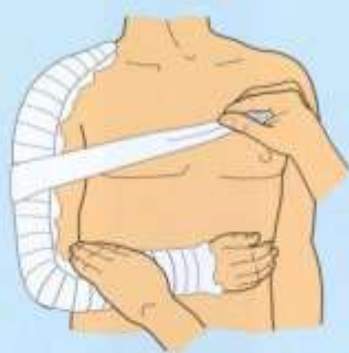
Шинной или при помощи полы куртки (плеча)