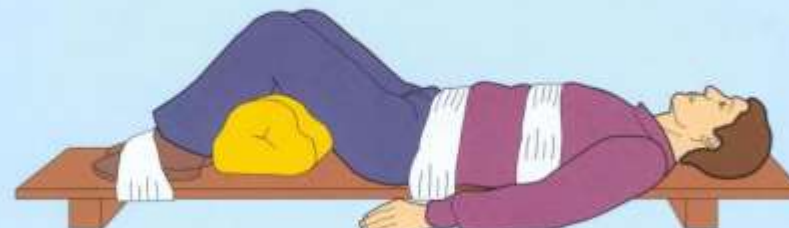
Щитом и валиком (костей таза)