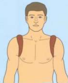
Матерчатými кольцами (ключицы)