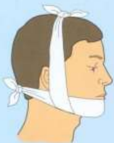
Пращевидной повязкой (нижней челюсти)