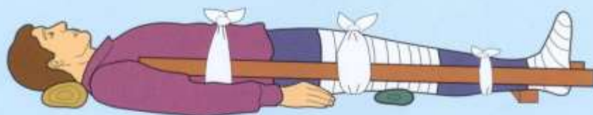
Подручным средством (бедра)