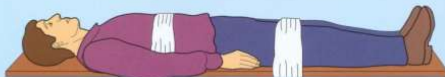
Деревянным щитом (позвоночника)