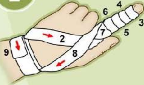
Повязка на палец