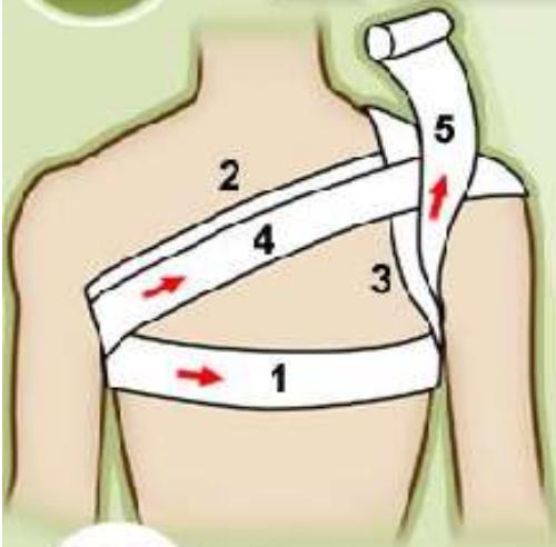
Повязка на плечевой сустав