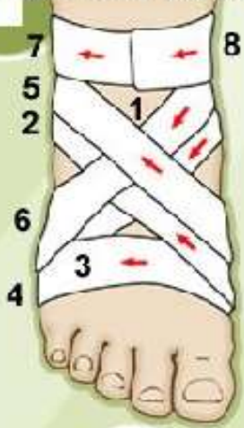
Повязка на голеностоп