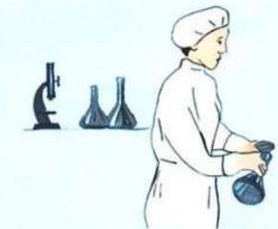
Пить воду и употреблять пищу — только после лабораторного контроля!