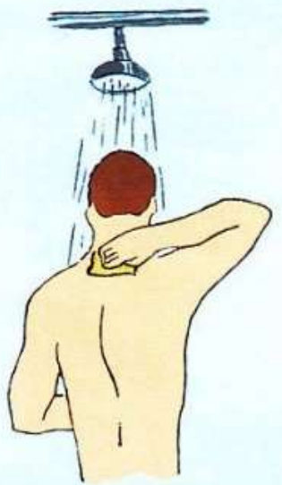
Обмыть пострадавшего, сменить одежду и обувь