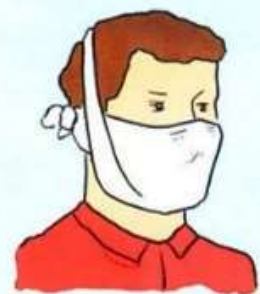
При отсутствии респиратора надеть ватно-марлевую повязку