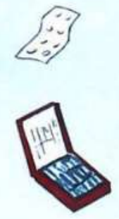
Дать таблетку йодистого калия Взрослым и детям старше 2 лет — по 1 таблетке (0,125 г), детям до 2 лет — по 1 таблетке (0,04 г)