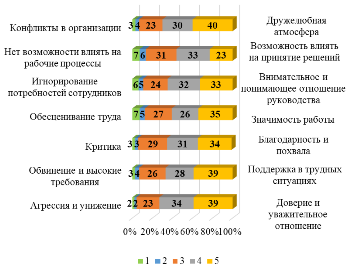
Рис. 3. Оценка уровня социального самочувствия у социальных работников и сиделок Ставропольского края: атмосфера в коллективе

Ежегодное проведение исследований уровня сформированности эмоционального выгорания работников, групповых психологических тренингов и индивидуальных психологических консультаций позволит не только своевременно диагностировать проблему, предупредить появление симптомов, но и улучшить психологический климат в коллективах, во взаимоотношениях с клиентами, а значит и повысить качество предоставления социальных услуг в Ставропольском крае.